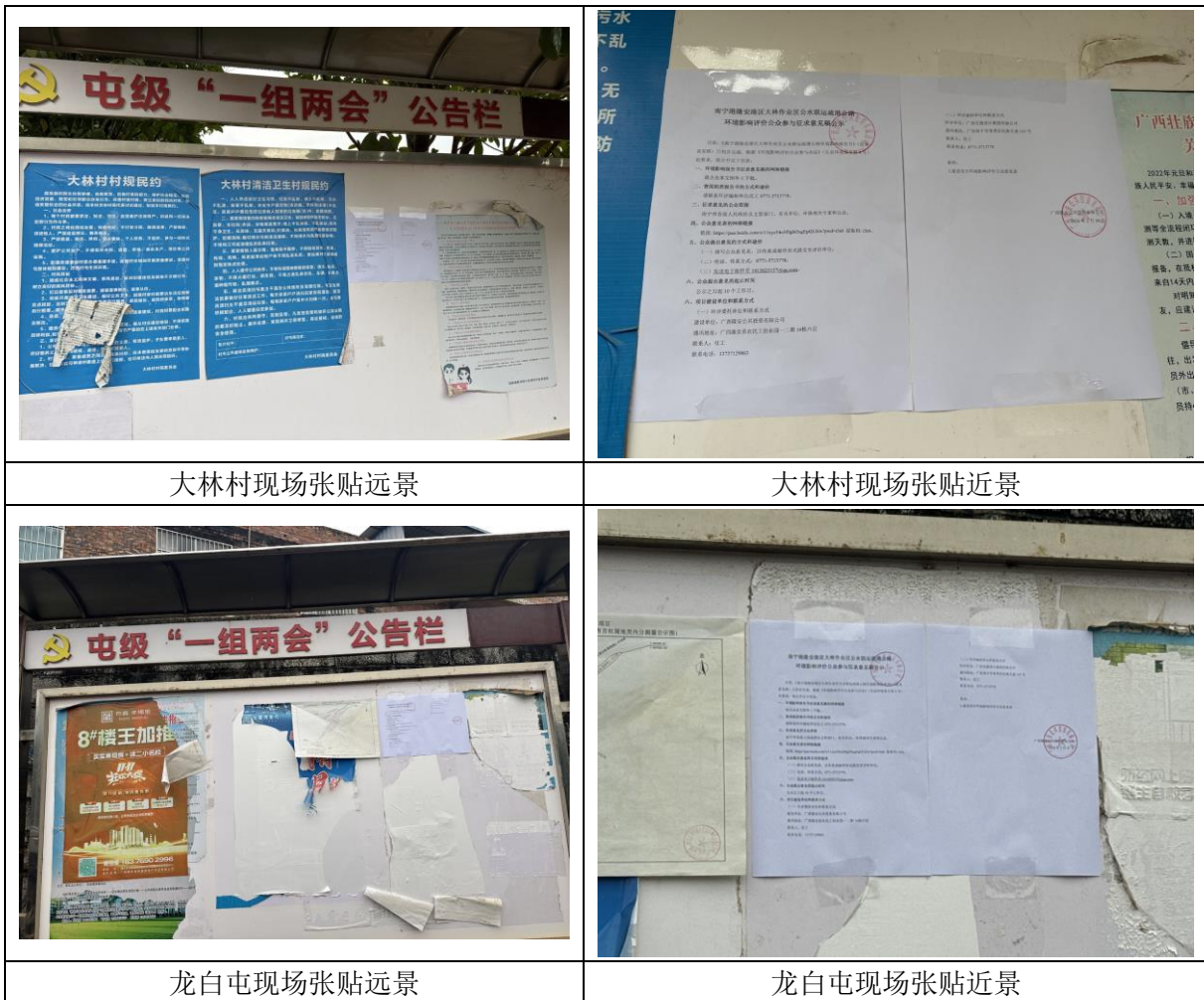
图5 本项目环境影响报告书征求意见稿张贴情况现场照片

我公司于2025年2月21日~3月6日在项目评价范围内大林村、敏感点龙白屯现场张贴公开了本项目的环评报告书征求意见稿的公示信息，张贴公告的现场照片见图5。