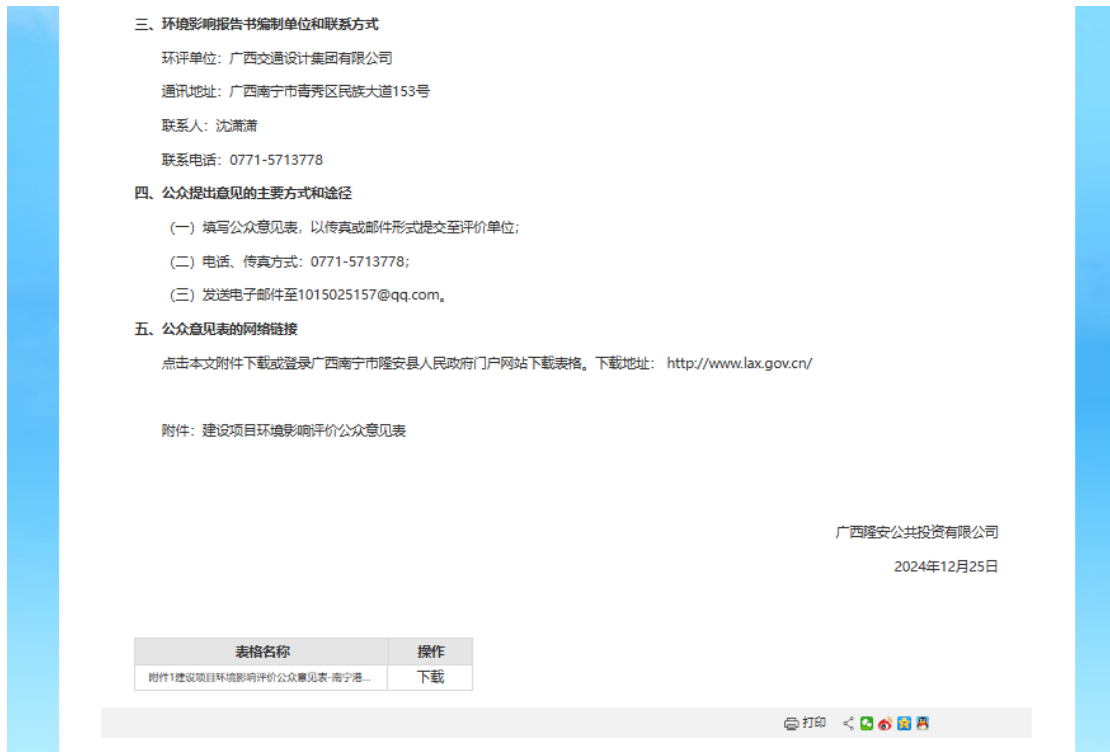
图1 本项目首次环境影响评价信息网上公开截图